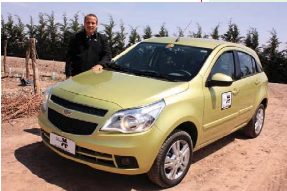
... em Mendoza (Argentina), durante o lançamento do Agile, ...