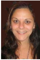
Por Heloisa Valente